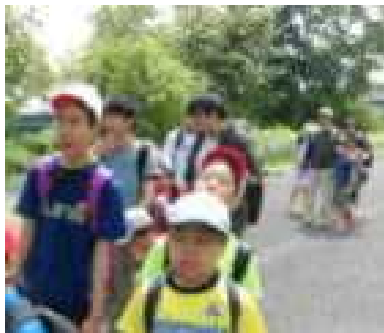
河川敷を歩きました