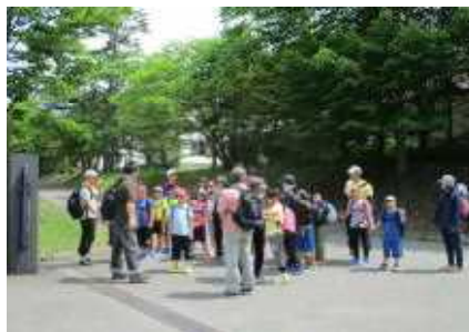
緑のセンターでボランティアの方と顔合わせ

午後からも、科学館までの1.9kmをがんばって歩きました。それぞれの目標をもちながら、最後まで歩くことができたり、公園でたくさん活動することができたりしました。